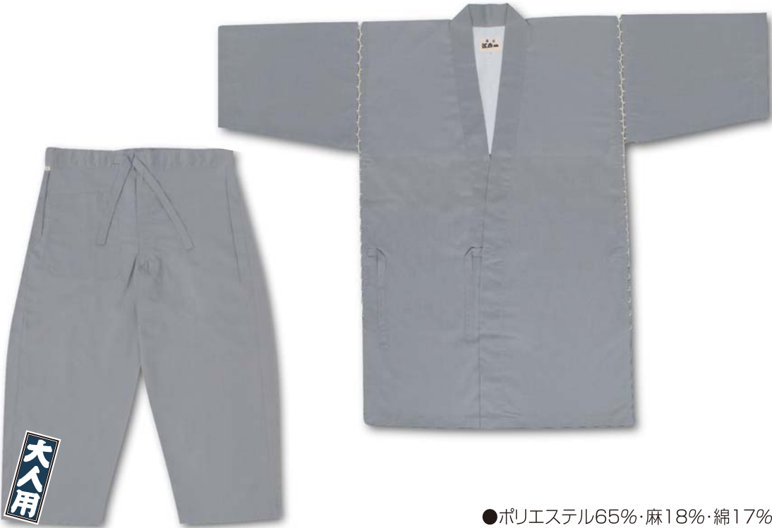
●ポリエステル65%・麻18%・綿17%