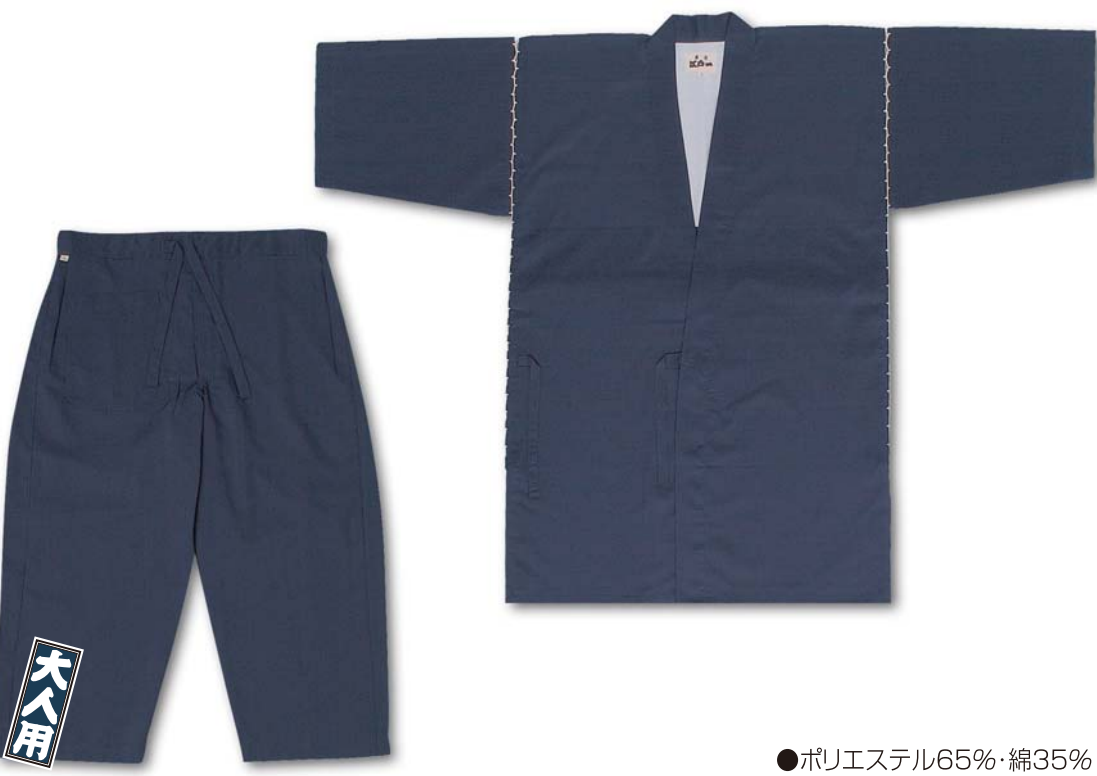
●ポリエステル65%・綿35%