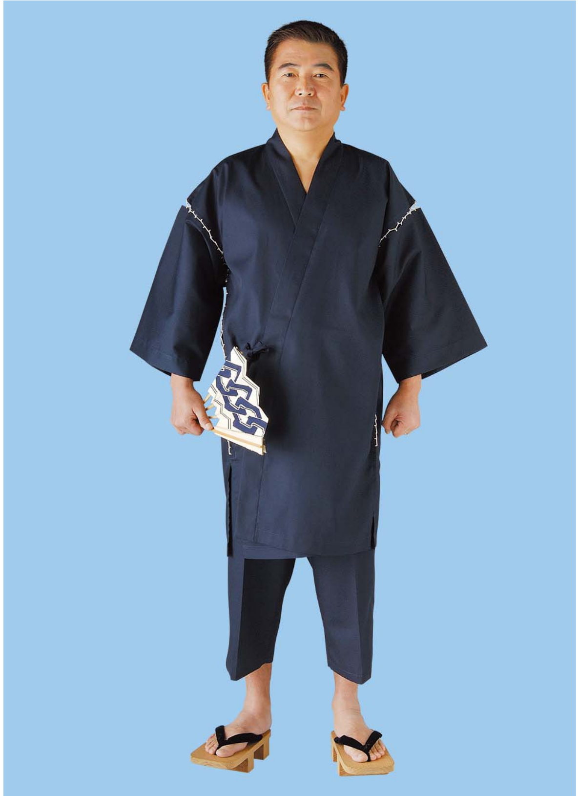
写真の甚平は、#5000T/C「紺」の寸です。