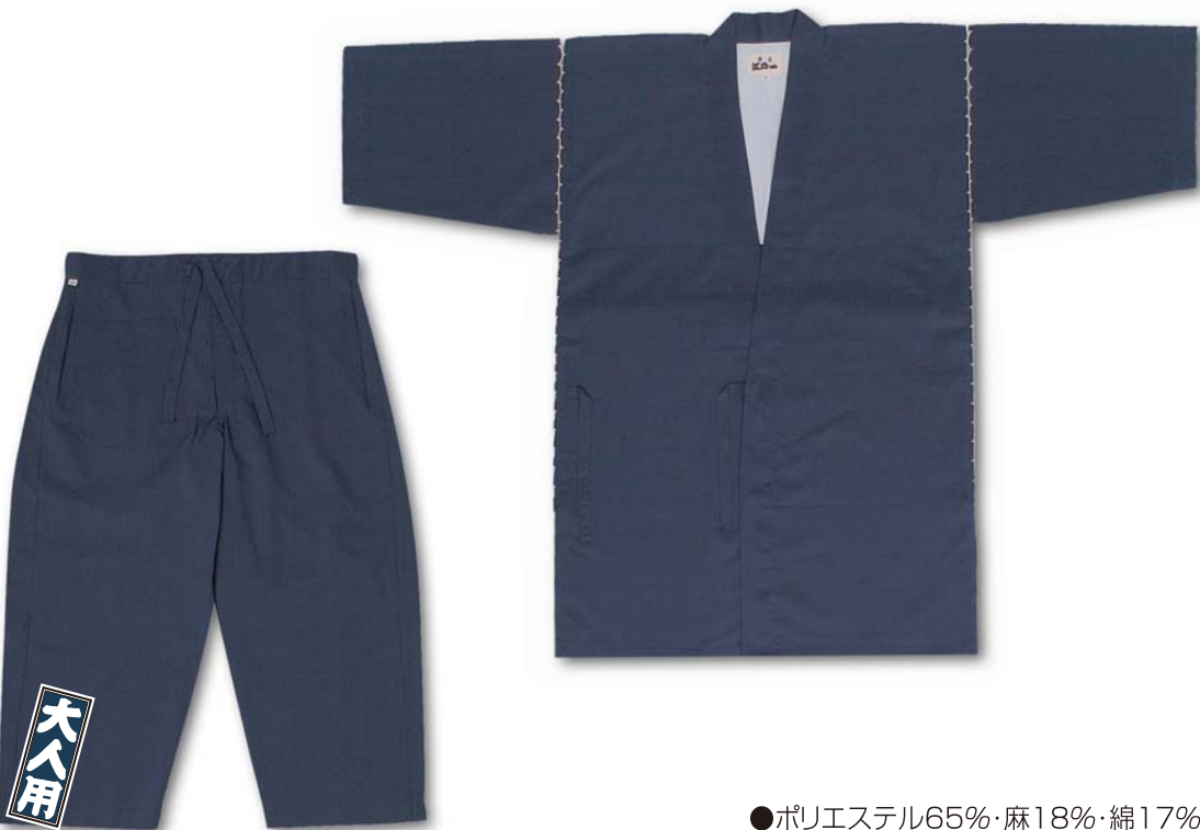
●ポリエステル65%・麻18%・綿17%