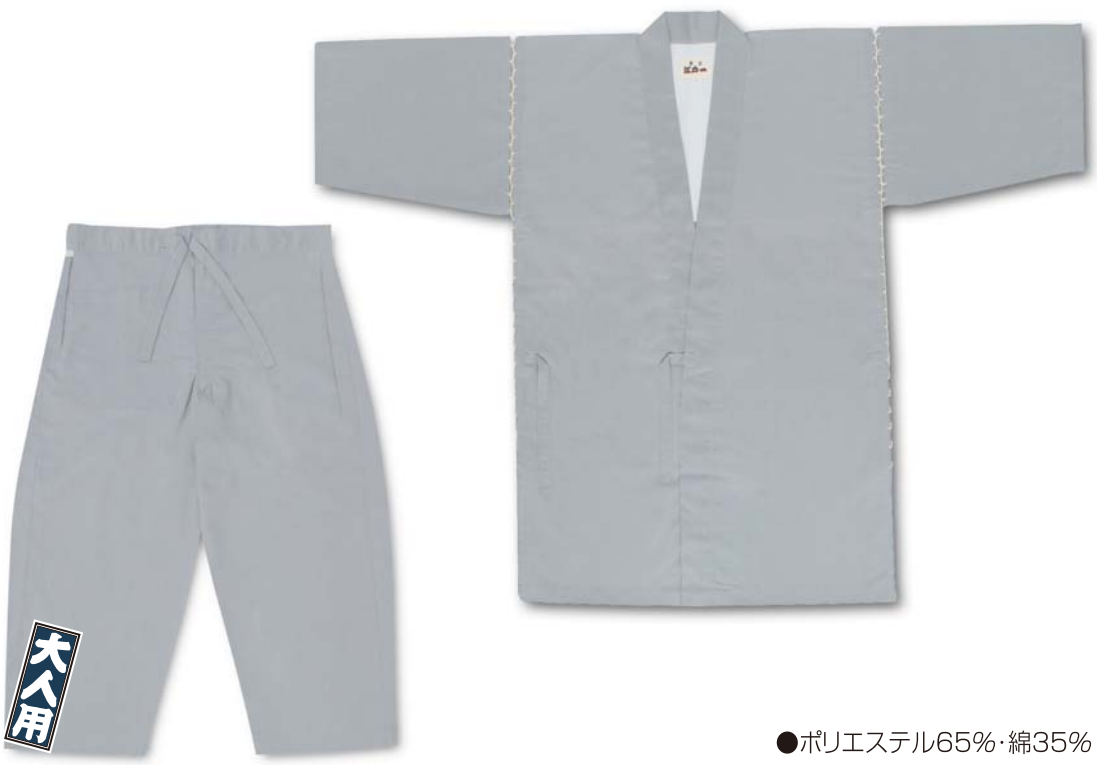
●ポリエステル65%・綿35%