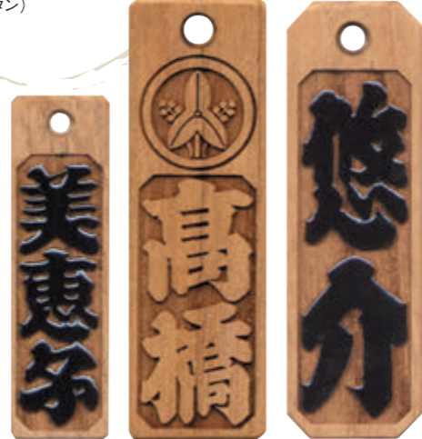
小(50×15×5) 大(62×20×5) 大隅切(62×20×5) 家紋と漆塗りは有料です。

檜材・桜材・櫟材・黒檀の銘木に、江戸文字でレーザー彫刻。首掛け紐や漆塗り、家紋でさらに際立ちを楽しむ。