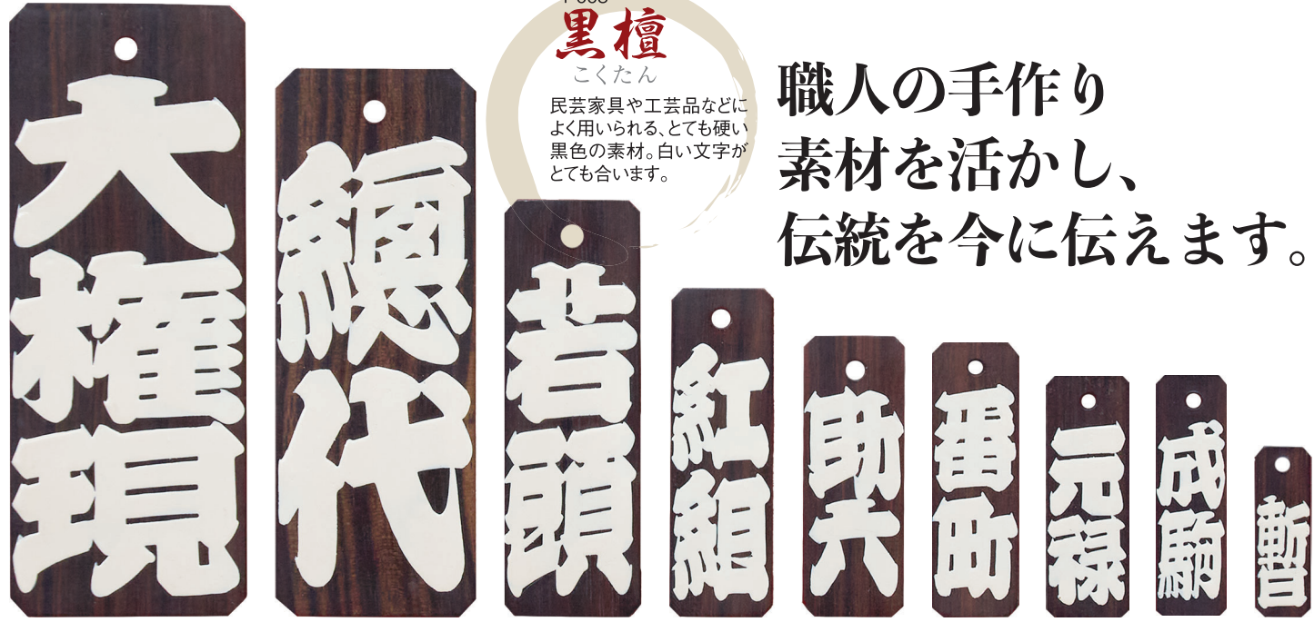
特々大(90×35×2) 特大(80×30×2) 大(60×20×2) 中(48×15×2) 中短(40×15×2) 小(40×12×2) 小短(35×12×2) 豆(35×10×2) 極豆(25×8×2)

民芸家具や工芸品などによく用いられる、とても硬い黒色の素材。白い文字がとてま合います。