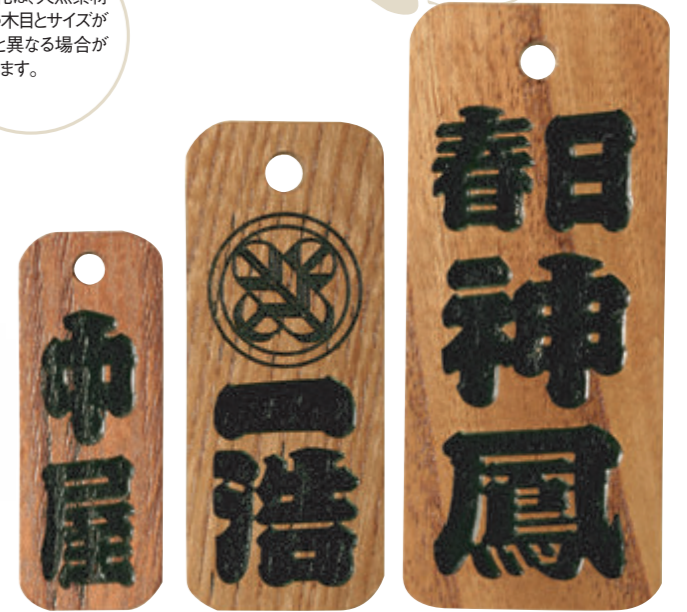
小(50×18×7) 中(65×26×7) 大(80×35×7)

くびさげきふだ (小除) 神輿を担ぐ時にはもってこの首下げタイプです。大・中には太め、小には細めの黒い首下げ紐が付きま。素材は櫟(ケヤキ)です。(すべて厚さ7mm)