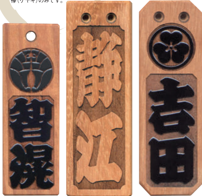
新サイズ(75×25×7) 特大(84×28×8) 特大隅切(84×28×8) 家紋と漆塗りは有料です。

あつくちタイプ 文字を片面彫刻、首掛け紐(長さ:約90cm)が付いています。素材は櫟(ケヤキ)のみです。