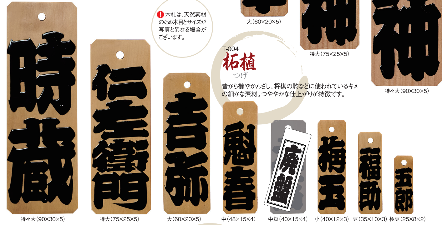
特々大(90×30×5) 特大(75×25×5) 大(60×20×5) 中(48×15×4) 中短(40×15×4) 小(40×12×3) 豆(35×10×3) 極豆(25×8×2)

昔から櫛やかんざし、将棋の駒などに使われているキメの細かな素材。つややかな仕上がりが特徴です。