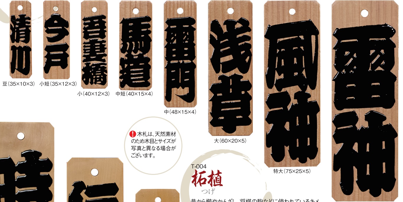
豆(35×10×3) 小短(35×12×3) 小(40×12×3) 中短(40×15×4) 中(48×15×4) 大(60×20×5) 特大(75×25×5) 特々大(90×30×5)

昔から仏像や家の柱などに使われているとても高価な素材。サイズがいろいろと選べます。